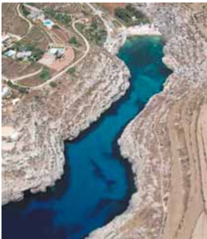
Gozo - Mgarr Ix-Xini.

Volontiers nous vous conseillerons pour le réaliser de façon individuelle.