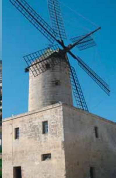
Gozo - Xewkija.